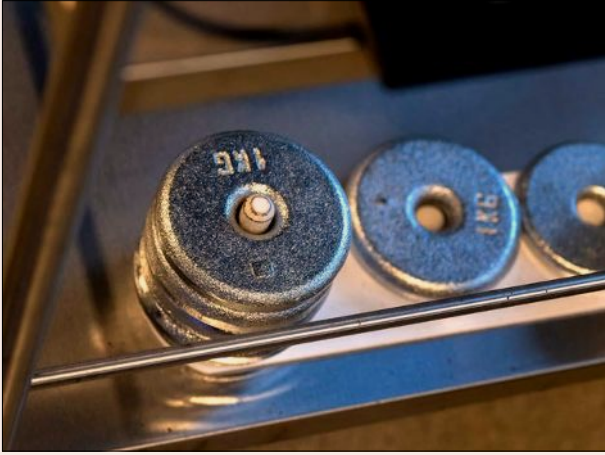
SVAREN GER TYNGD. Individanpassad träning utgår från svaren på hälso- och prestationstesterna.